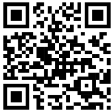
รายงานประชุมครู๑.๒๕๖๙ รร.พะเยาพิทยาคม มติที่ประชุม.....

รายงานการประชุมผู้บริหารการศึกษา ข้าราชการครูและบุคลากรทางการศึกษา สังกัดสำนักงานเขตพื้นที่การศึกษามัธยมศึกษาพะเยาครั้งที่ ๑/๒๕๖๙ (ผอ.สพม.พะเยา พบเพื่อนครู) ในวันอาทิตย์ที่ ๙ พฤศจิกายน ๒๕๖๘ เวลา ๐๘.๓๐ - ๑๒.๐๐ น. ณ โรงเรียนพะเยาพิทยาคม อำเภอเมืองพะเยา จังหวัดพะเยา และเวลา ๑๓.๓๐ - ๑๗.๐๐ น. ณ โรงเรียนจุนวิทยาคม อำเภอจุน จังหวัดพะเยา (รายละเอียดได้จัดส่งตามหนังสือสำนักงานเขตพื้นที่การศึกษามัธยมศึกษาพะเยา ที่ ศธ ๔๓๑๙/ว๓๕๑๘ ลงวันที่ ๒๕ พฤศจิกายน ๒๕๖๘ และหนังสือสำนักงานเขตพื้นที่การศึกษามัธยมศึกษาพะเยา ที่ ศธ ๔๓๑๙/ว๓๕๑๙ ลงวันที่ ๒๕ พฤศจิกายน ๒๕๖๘) หรือสามารถสแกน QR CODE แนบท้ายนี้