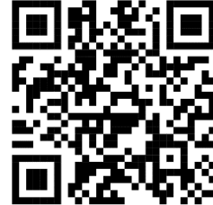
รายงานประชุมครู๑.๒๕๖๙ รร.จุนวิทยาคม