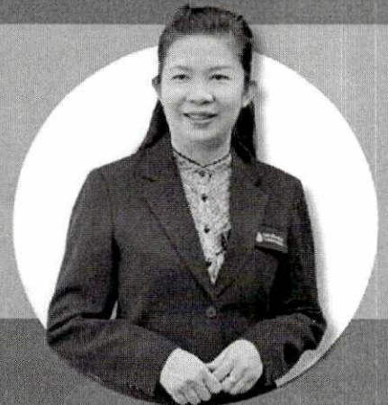
ผู้ดำเนินรายการ

การช่วยเหลือนักเรียน บกพร่องทางการเรียนรู้ (LD) Dylexia, Dycalculia, Dygraphia