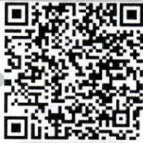
QR code ลงทะเบียน